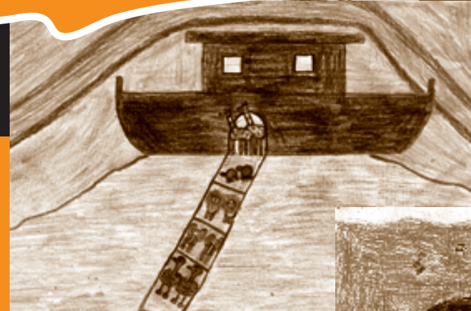
Ark van Noach